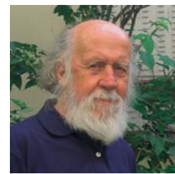
Hubert Reeves 12ème Université